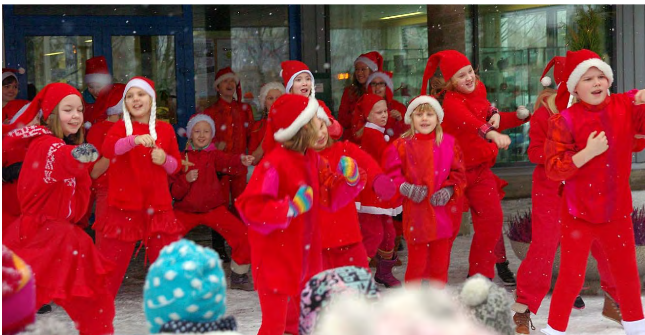
"JOULUN JA TANSSIN ILOA" tontut ja vuoden hittiä Tontut E1-2, tuunatut koosteasut, Haapajärvi 2014&Tonttulakit