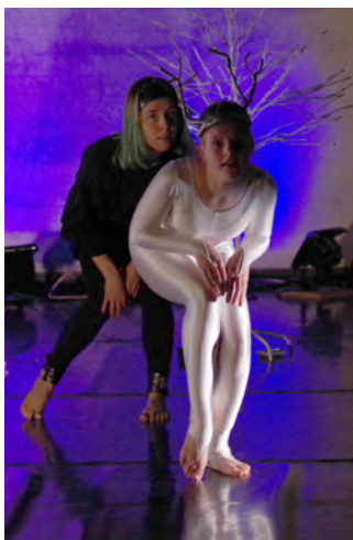
"VALKOINEN PEURA&MYRSKY" E12.-13.