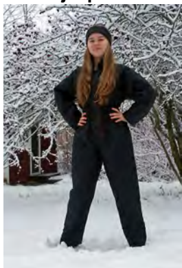
"Synkillä poluilla" 2002, muunneltavissa moneksi