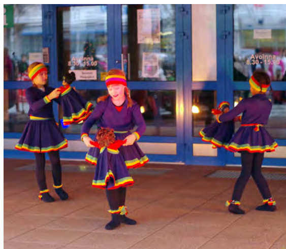
"Pikku Lapinäidit" Haapajärvi 2014 E6