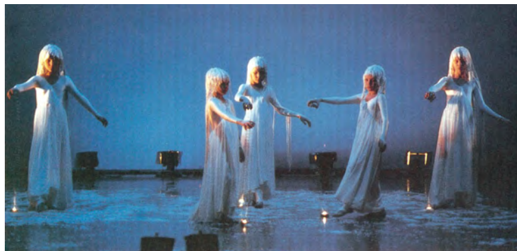
"TALVENVALOA"–Kurjenpolvet-ryhmä Soul 1998 E11.