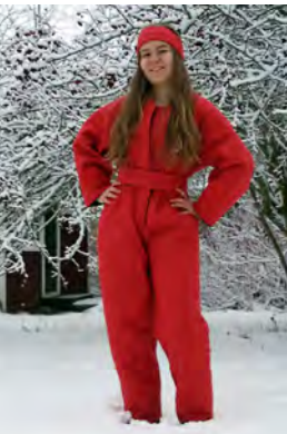
"Ilomielen punaista" edell. nurin, tuunaus lisukkein