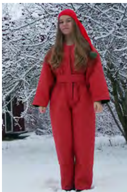
"Piippalakkitonttuna" jne. - taipuu varsin moneksi