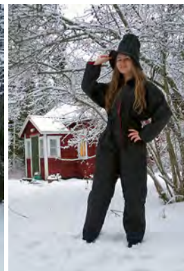
"Helppo hassutella", sadun tohtorin hattu esimerkkinä