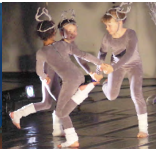
"HEI KAIKKI PUUROLLE!" – Tontut E1.1.-5., Porot E4, koosteasut "Pikkuporot" E5, daCi Tanska 2015