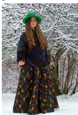
"Nyky-Pääsiäisnoita" 2002 Nivala, muuntuu moneen

ULKOILMATANSSIA-SÄÄLLÄKUINSÄÄLLÄ Kurjenpolvet-kokoelma / Taideosuukunta TANSSIAITAT