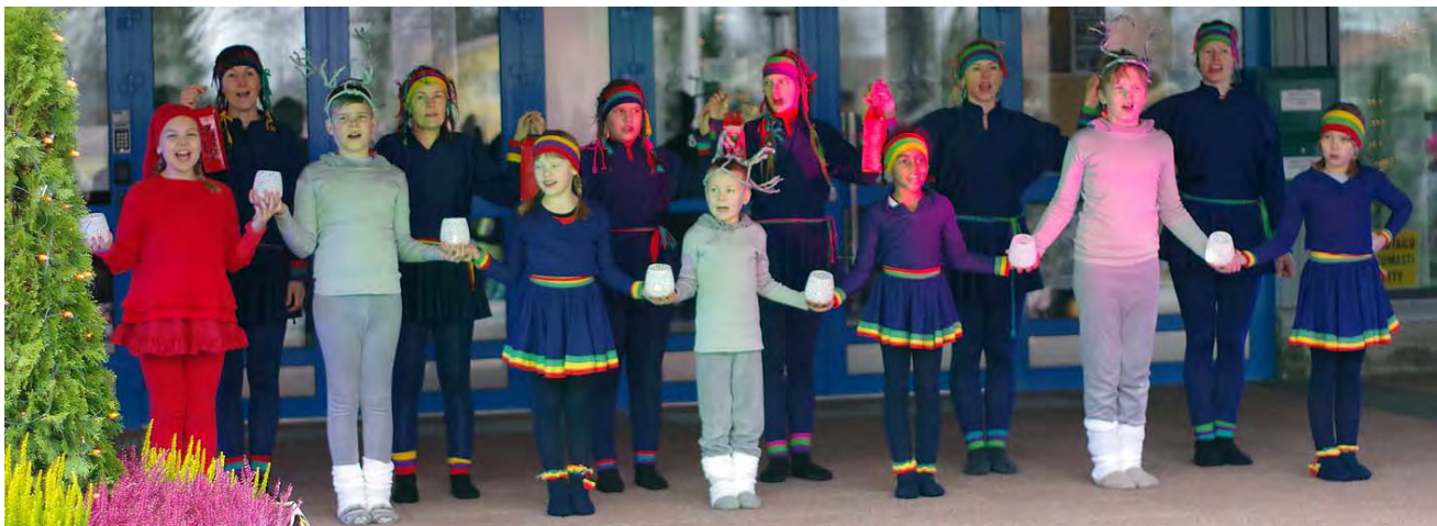
"HYVÄÄ JOULUA!"-jouluvierailun Haapajärvi 2014 - Tontut E1, Porot E4, Pikku Lapinäidit E6, Joiku E7, Lyhdyt E8