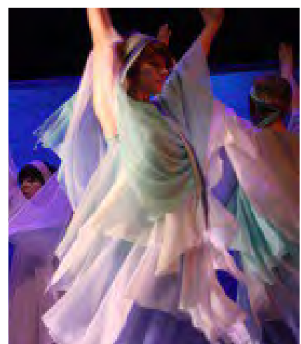
"Revontulet" Timanttipuu 2010 E13